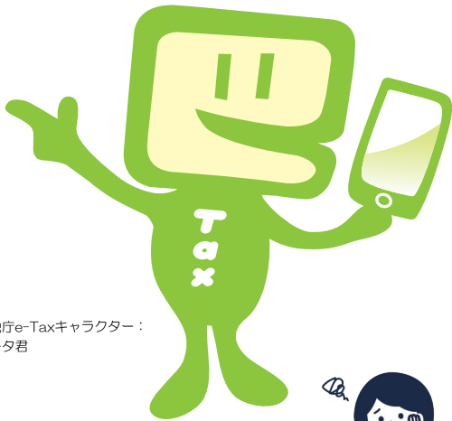
国税庁e-Taxキャラクター： イータ君

国税の場合はe-Tax、地方税の場合はeLTAXを利用して、事前に届出をした 預貯金口座からの振替により、簡単な 操作で税金を納付することができる 便利な電子納税の手段です。